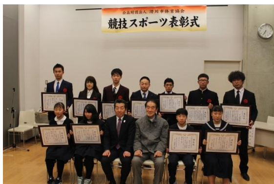
競技スポーツ表彰