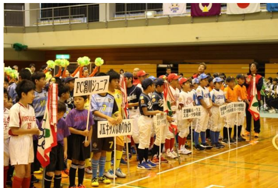
スポーツ団体の入場