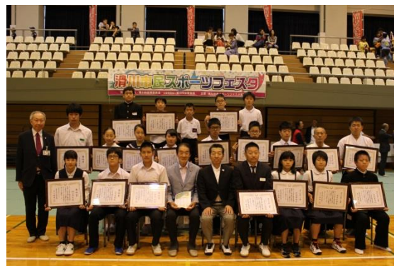
生涯スポーツ表彰式