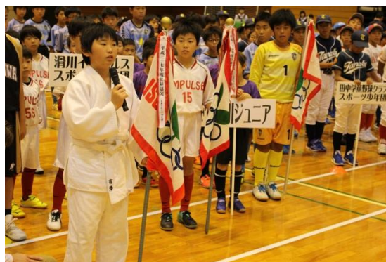
スポーツ少年団結団式