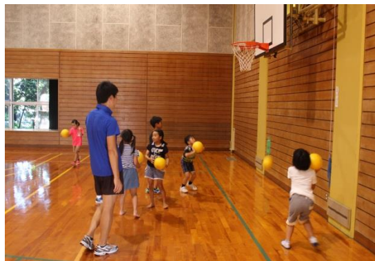
キッズ・スポーツ塾