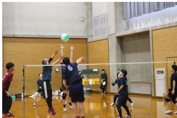
市民ビーチボールフェスタ