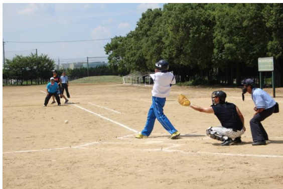
市民ソフトボール大会