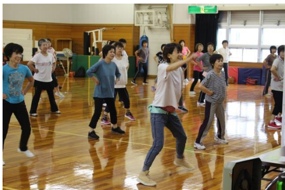
9月フィットネスの日