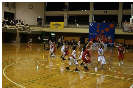
市民バスケットボール大会