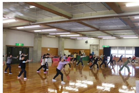
12月フィットネスの日