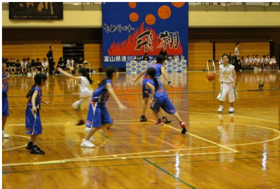
バスケットボール競技